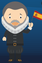
Miguel de Cervantes Spagna