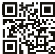
Sistema Bibliotecario Urbano - Bergamo