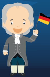
Johann Wolfgang von Goethe Germania