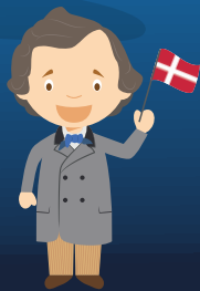
Hans Christian Andersen Danimarca