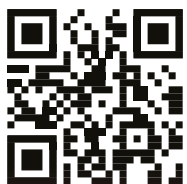
Biblioteca Civica Angelo Mai

La cultura a sistema Scopri gli appuntamenti