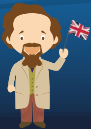
Charles Dickens Inghilterra